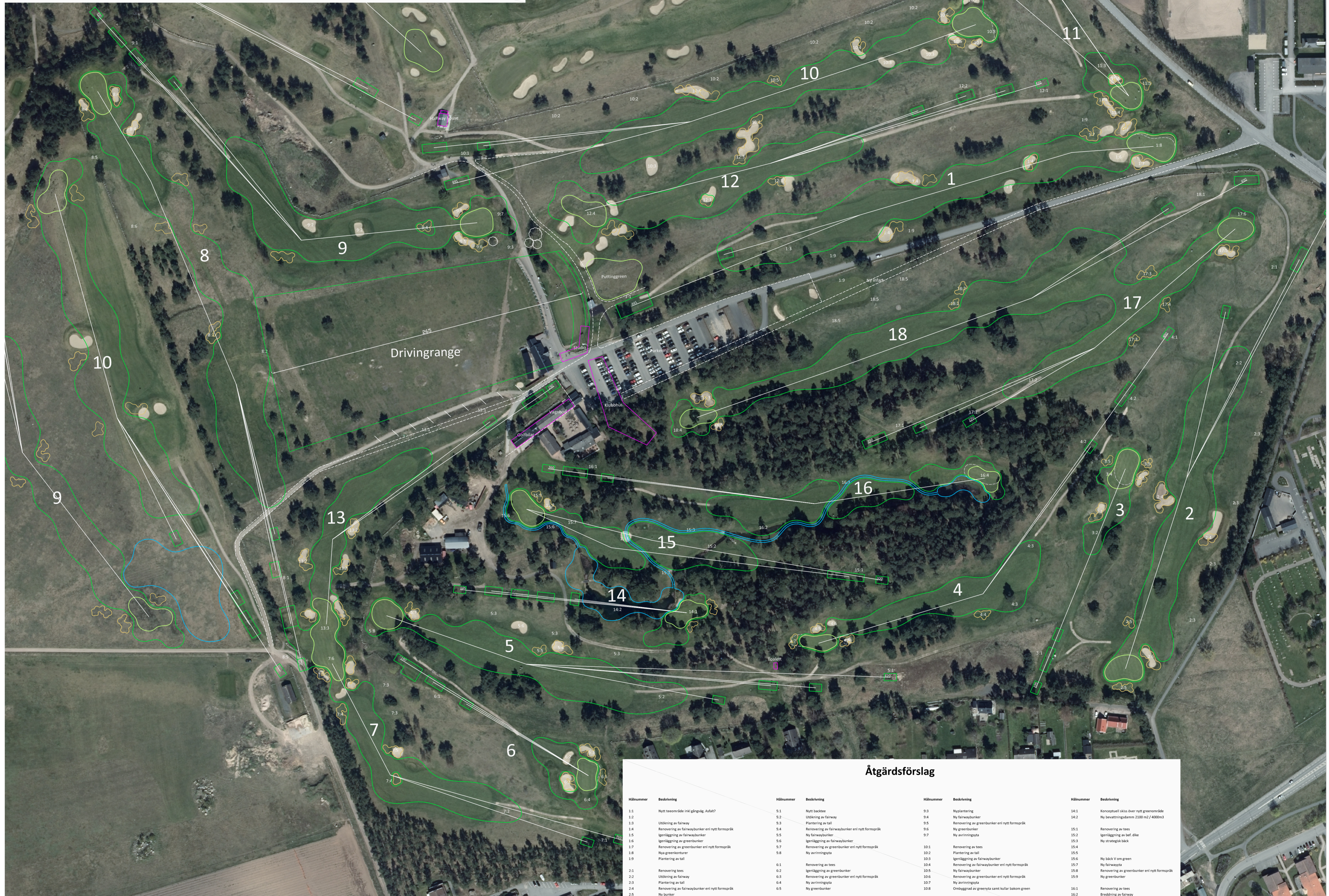
Exempelbilder - Östra Banan